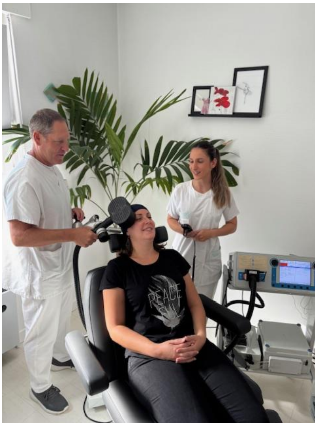
Salle de traitement